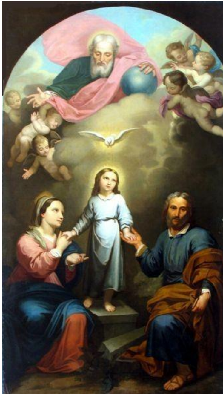
Svatá rodina, 1865